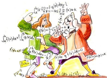
Figura 1: Ilustração de Leibniz e Newton em um “combate”.

Newton e Leibniz, dois célebres pesquisadores que travaram uma briga acirrada pela autoria do Cálculo.