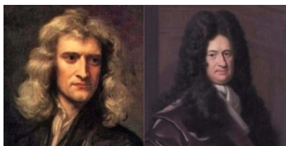
Figura 2: Newton (esquerda) e Leibniz (direita).

Na busca de melhor compreensão do assunto, foram feitas pesquisas em livros, artigos, sites ou vídeos que apresentassem foco no tema. Conforme relatos de artigos, essa disputa, ocorrida no século XVII, durou mais de dez anos e seguiu até o final de suas vidas.